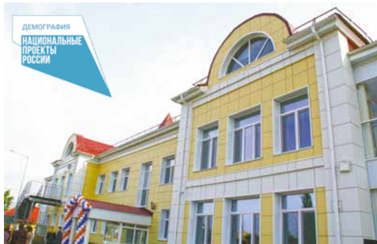
Открытие детского сада на 21-й Рабочей

Для воспитанников созданы комфортные условия: уютные спальные и групповые комнаты, интересные конструкции детской мебели, разнообразный игровой, дидактический материал. Установлены удобные кабинки для одежды. Все оборудование выполнено в яркой цветовой гамме. В здании имеются спортивный и музыкальный залы, медицинский блок. Предусмотрены автоматическая пожарная сигнализация с выводом сигнала на пульт управления пожарной охраны, тревожная кнопка и запасные эвакуационные выходы.