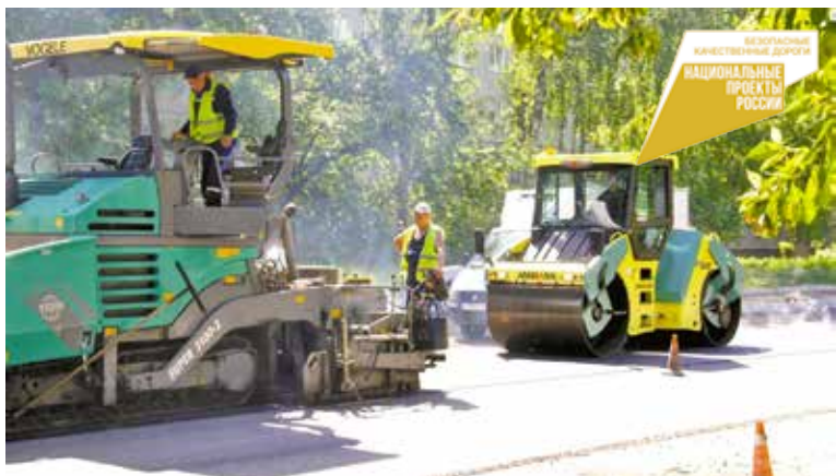
Ремонт дорог в рамках национального проекта «Безопасные и качественные автомобильные дороги»