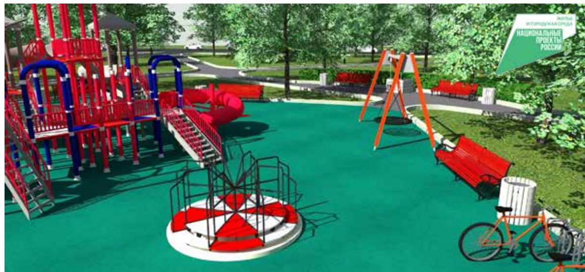
Уже в апреле этого года начнется комплексное благоустройство сквера «Рубиновая мечта» в границах улиц 1-я Военная – Кирова – 4-я Рабочая

в апреле. Подрядные организации должны приступить к подготовительным работам на территориях уже весной, по условиям контрак-