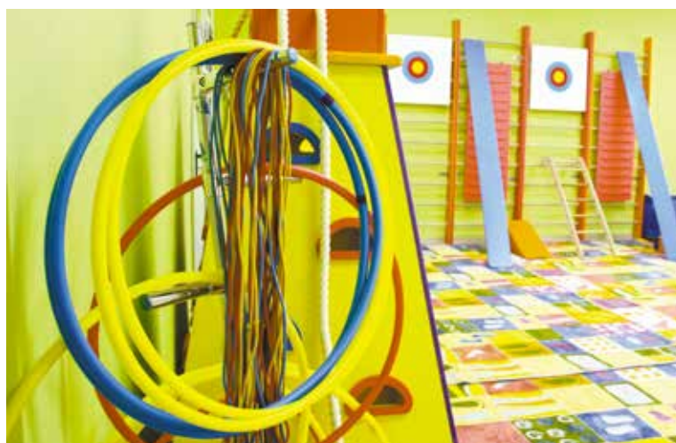
В новом детском саду для детей созданы комфортные условия

В школе предполагается реализация образовательной программы с инженерным уклоном, с углубленным изучением предметов, способствующих в дальнейшем приобретению технических специальностей. Школа будет взаимодействовать с ведущими техническими вузами.