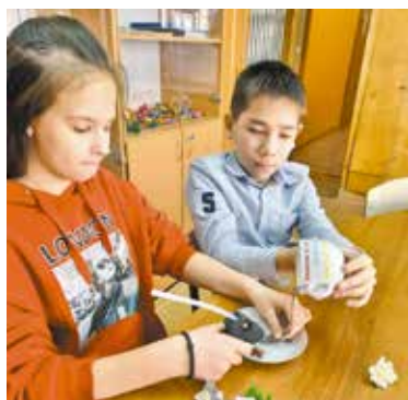
Подготовка к конкурсу

Мероприятие было организовано окружной администрацией совместно с местным советом ветеранов. Участники смогли показать свои таланты в трех номинациях: «Рисунок», «Творчество», «Искусство». В двух первых работы принимались в онлайн-режиме, в последней – непосредственно в администрации. Участники конкурса определялись в своих возрастных категориях. Всего в конкурсе приняли участие 119 человек.