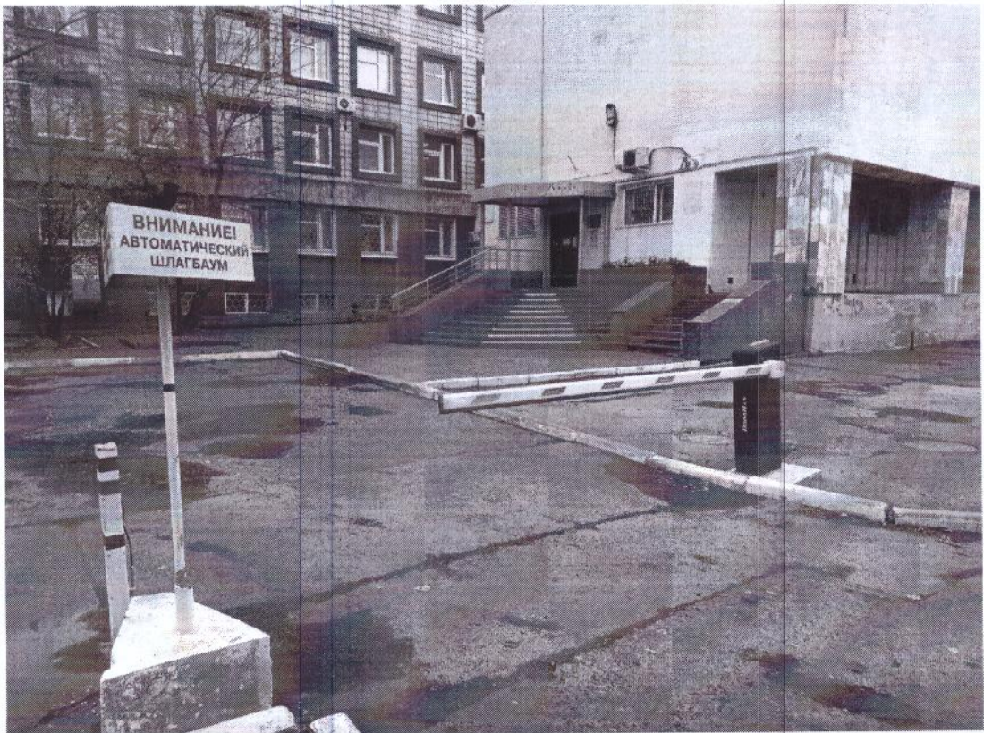
г. Омск, Центральный АО, в 10 м. юго-восточнее здания 13 по ул. Певцова