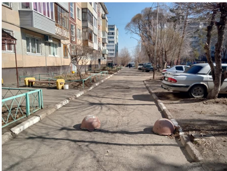
г. Омск, Кировский АО, в 5-7 м. восточнее многоквартирного дома № 3Б по ул. Путилова