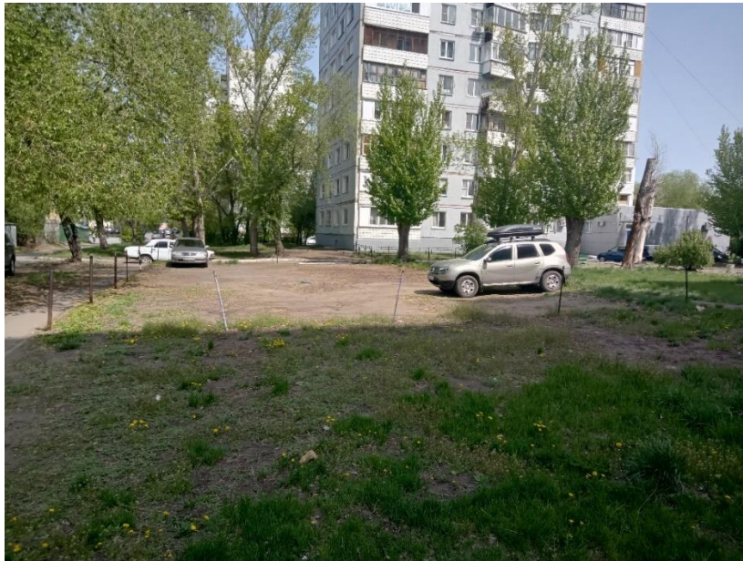
г. Омск, Ленинский АО, в 9-32 м. юго-западнее многоквартирного дома № 8 по ул. Котельникова