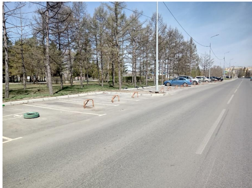
г. Омск, Кировский АО, в 34 м. западнее многоквартирного дома № 21 по ул. Лукашевича