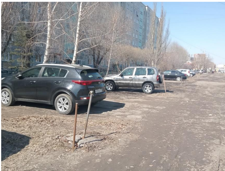
г. Омск, Кировский АО, в 25-29 м. севернее многоквартирного дома № 13 по ул. 70 лет Октября