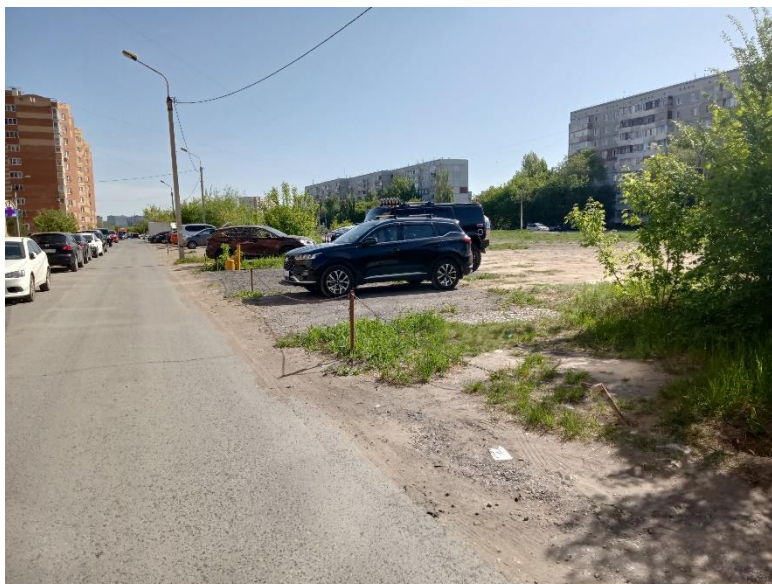
г. Омск, Кировский АО, в 18-48 м. северо-восточнее многоквартирного дома № 8 по бул. Архитекторов