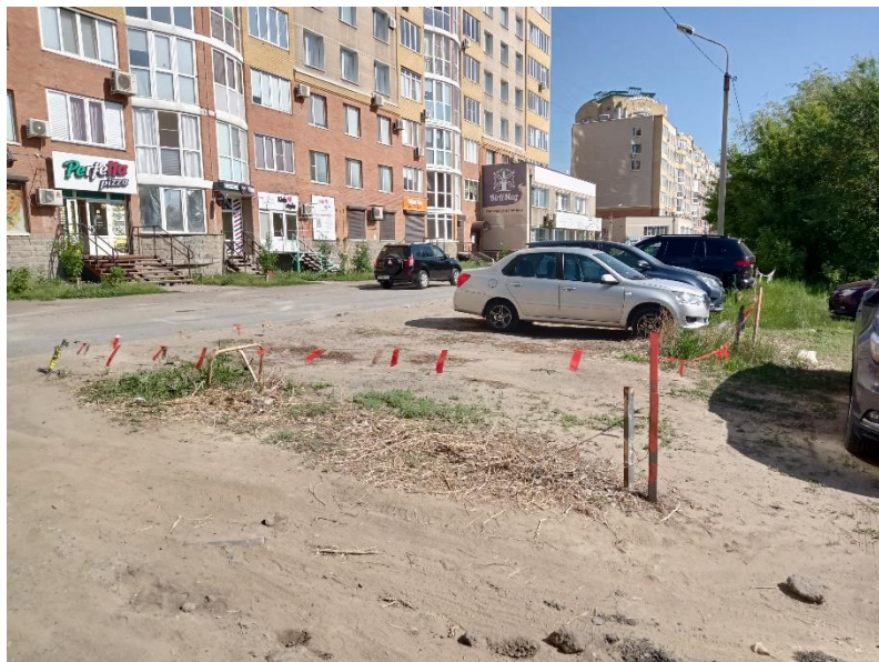
г. Омск, Кировский АО, в 16-22 м. юго-восточнее многоквартирного дома № 12 по бул. Архитекторов