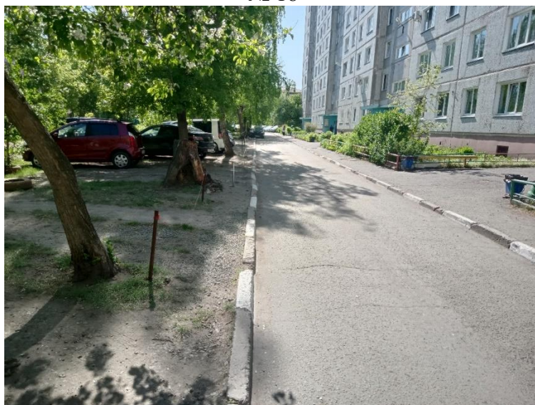
Кировский АО, в 11 м. северо-западнее многоквартирного дома № 3А по ул. Взлетная