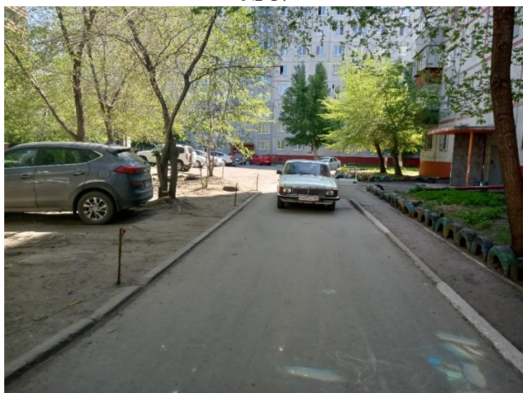
г. Омск, Кировский АО, в 8-10 м. северо-восточнее многоквартирного дома № 10/1 по ул. Рокоссовского