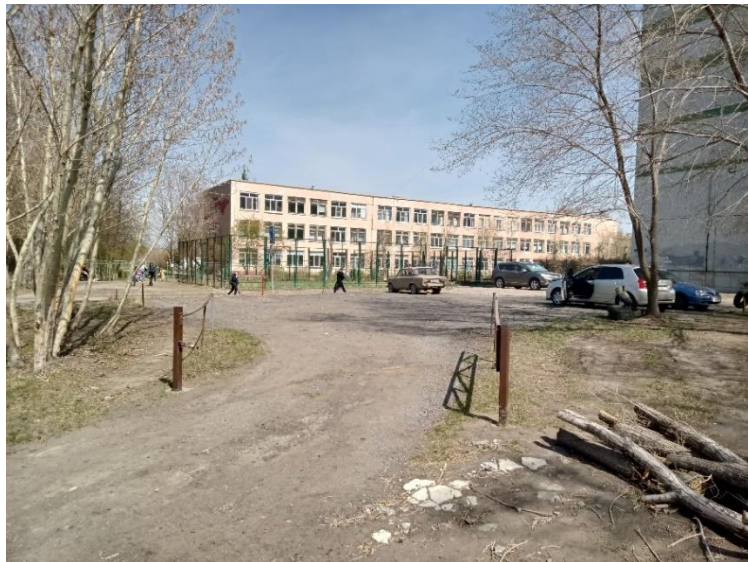
г. Омск, Кировский АО, в 22-30 м. восточнее многоквартирного дома № 12 корп. 1 по ул. Дианова