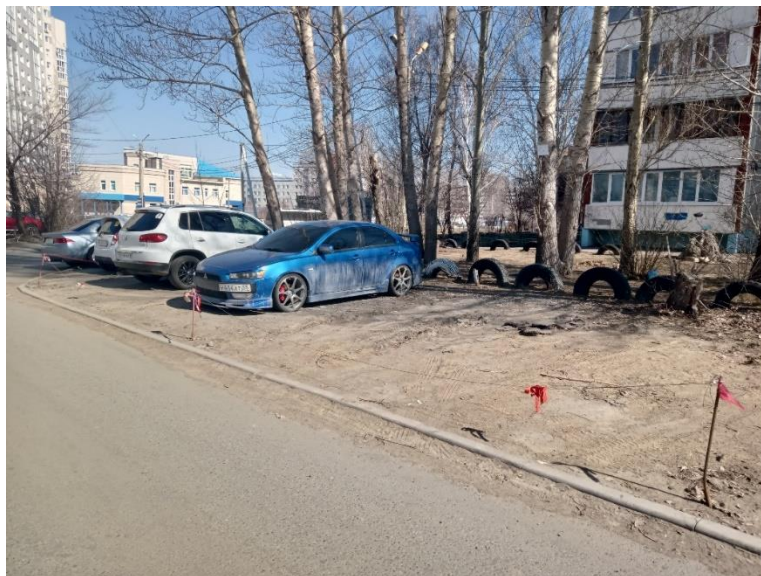
г. Омск, Кировский АО, в 14-19 м. северо-восточнее многоквартирного дома № 11 по ул. Дмитриева