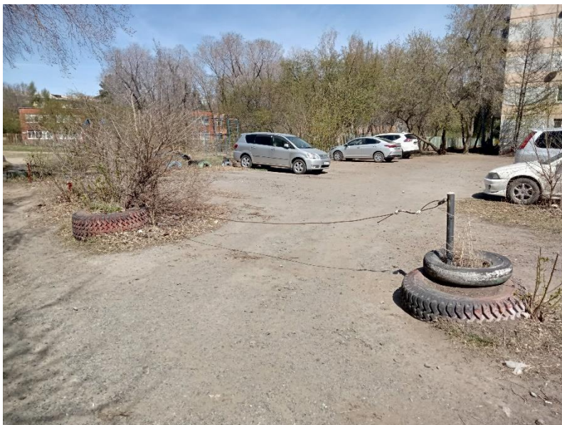
г. Омск, Кировский АО, в 13-30 м. северо-восточнее многоквартирного дома № 3В по ул. Путилова