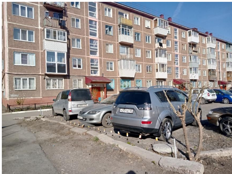
г. Омск, Советский АО, в 10-20 м. юго-восточнее многоквартирного дома № 50 по ул. Химиков