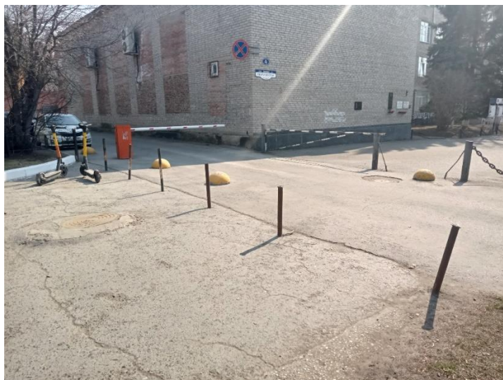
г. Омск, Центральный АО, в 8-20 м. северо-восточнее здания № 4 по ул. Ивана Алексеева