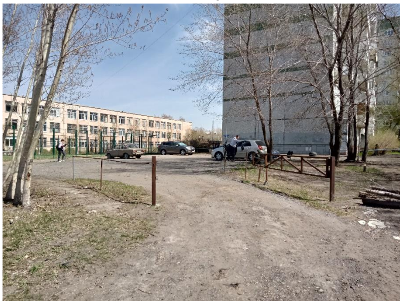
г. Омск, Кировский АО, в 22-30 м. восточнее многоквартирного дома № 12 корп. 1 по ул. Дианова