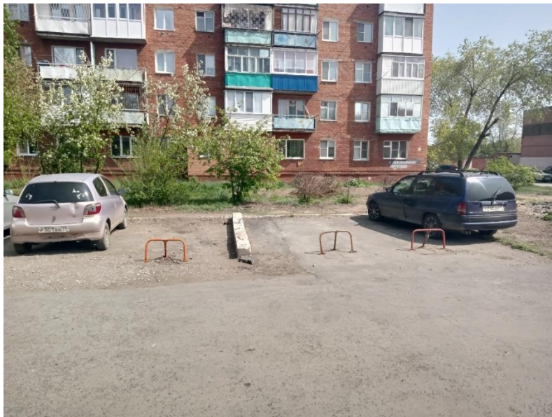
г. Омск, Октябрьский, в 25 м. юго-восточнее многоквартирного дома № 12 по ул. 4-я Железнодорожная