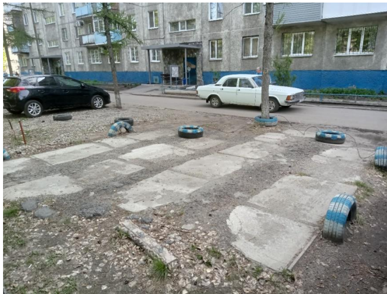
г. Омск, Советский АО, в 10-15 м. севернее многоквартирного дома № 14 по просп. Королева