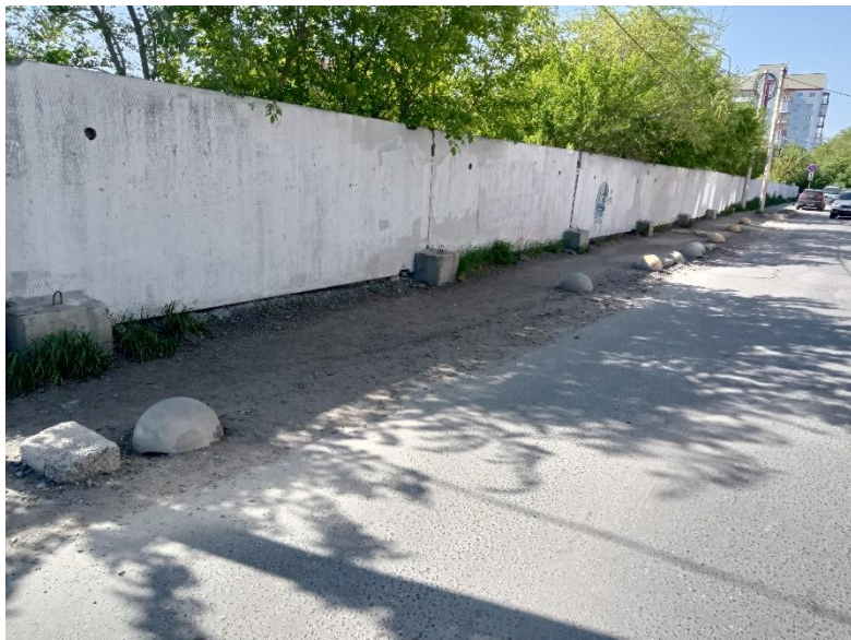
г. Омск, Кировский АО, в 17 м. юго-восточнее многоквартирного дома № 9 по просп. Комарова