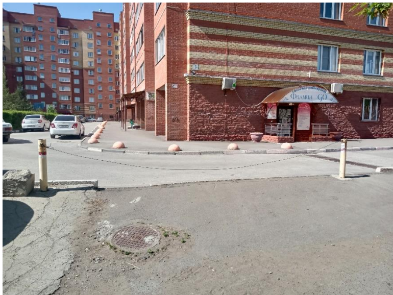
г. Омск, Кировский АО, в 10 м. северо-восточнее многоквартирного дома № 12, корпус 1 по ул. Перелета