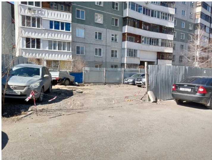
г. Омск, Центральный АО, в 17 м. юго-восточнее многоквартирного дома № 127 по ул. Омская