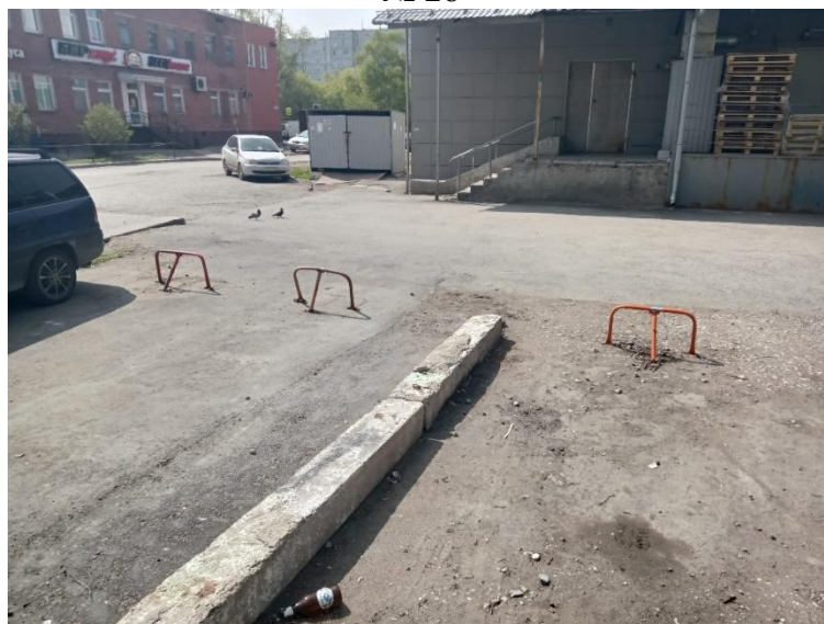
г. Омск, Октябрьский АО, в 25 м. юго-восточнее многоквартирного дома № 12 по ул. 4-я Железнодорожная