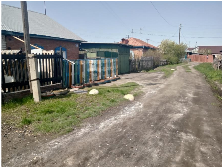
г. Омск, Ленинский АО, в 5-15 м. северо-восточнее индивидуального жилого дома № 19 по ул. 3-я Путевая