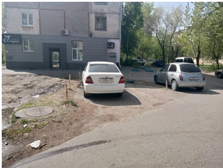
г. Омск, Октябрьский АО, в 7-12 м. севернее многоквартирного дома № 10 по ул. Петра Осминина