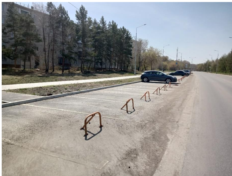
г. Омск, Кировский АО, в 36 м. западнее многоквартирного дома № 15 по ул. Лукашевича