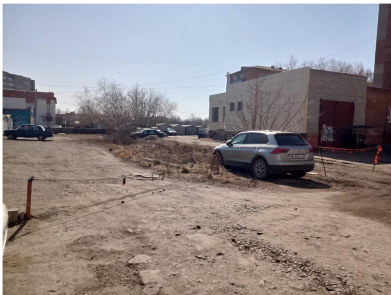
г. Омск, Кировский АО, в 38 м. северо-восточнее многоквартирного дома № 112 по ул. 12 Декабря