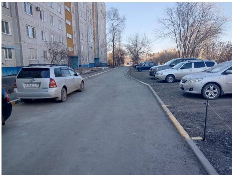
г. Омск, Кировский АО, в 12-14 м. севернее многоквартирного дома № 11 по ул. Дмитриева