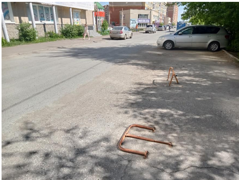
г. Омск, Кировский АО, в 16-22 м. юго-восточнее многоквартирного дома № 12 по бул. Архитекторов