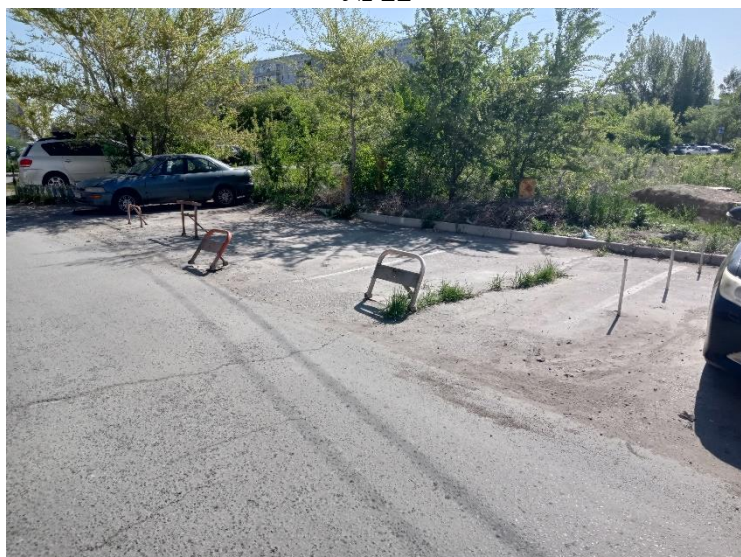
г. Омск, Кировский АО, в 18-48 м. северо-восточнее многоквартирного дома № 8 по бул. Архитекторов