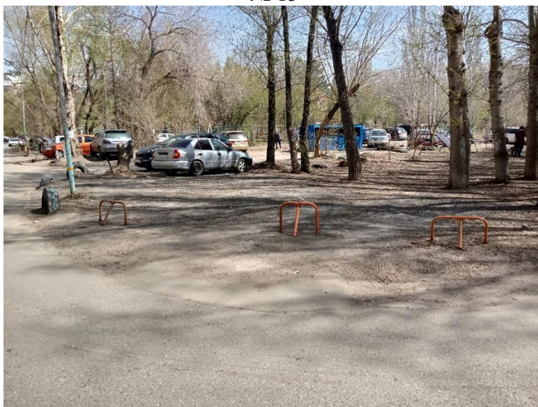
г. Омск, Кировский АО, в 20-40 м. юго-восточнее многоквартирного дома № 3 по ул. Путилова