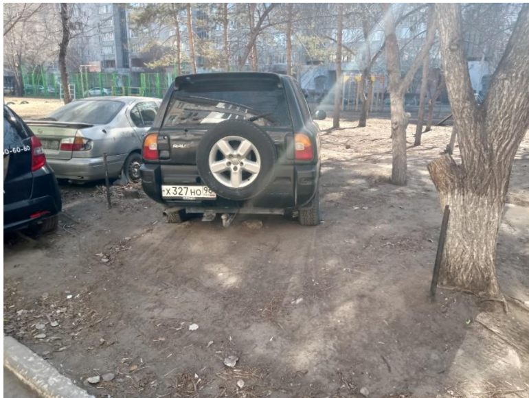
г. Омск, Кировский АО, в 9 м. восточнее многоквартирного дома № 3Б по ул. Путилова