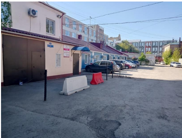
г. Омск, Центральный АО, в 5-7 м. восточнее здания № 18/8 по просп. К. Маркса