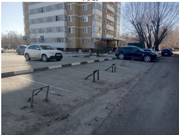
г. Омск, Кировский АО, в 32-53 м. северо-восточнее многоквартирного дома № 2/1 по ул. Лукашевича