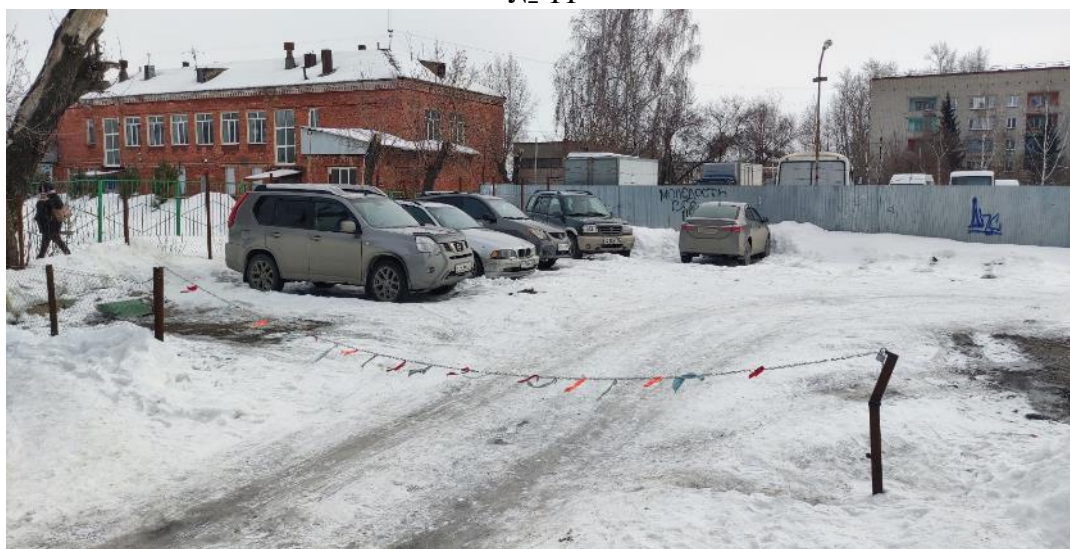
г. Омск, Ленинский АО, в 15-20 м. юго-восточнее многоквартирного дома № 91 по ул. Демьяна Бедного