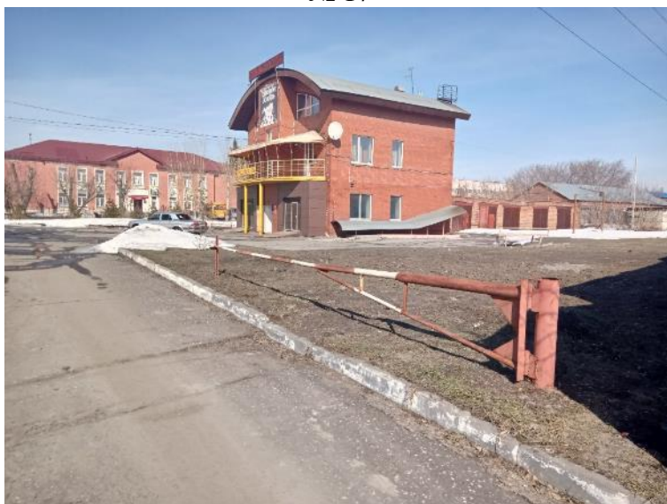
г. Омск, Октябрьский АО, в 22 м. юго-западнее здания № 279 по ул. Богдана Хмельницкого