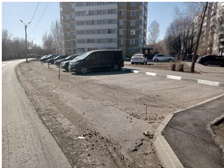
г. Омск, Кировский АО, на расстоянии от 60 м. северо-восточнее до 50 м. юго-западнее многоквартирного дома № 2/1 по ул. Лукашевича