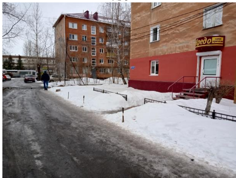
г. Омск, Советский АО, в 7 м. юго-восточнее многоквартирного дома № 34А по просп. Мира