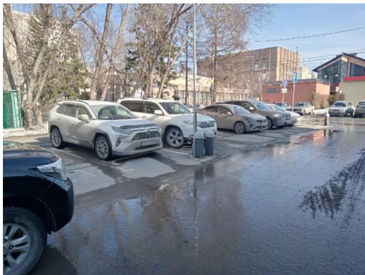
г. Омск, Центральный АО, на расстоянии от 25 м. северо-западнее до 20 м. северо-восточнее здания № 5 по ул. Певцова