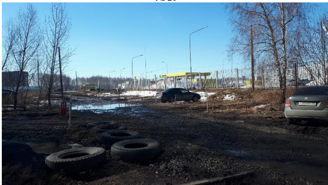
г. Омск, Кировский АО, в 11-35 м. юго-западнее многоквартирного дома № 44 по ул. Волгоградская