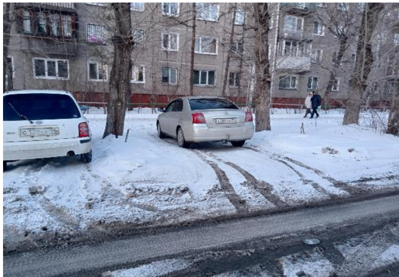
г. Омск, Ленинский АО, в 15-18 м. юго-западнее многоквартирного дома № 26А по ул. Серова