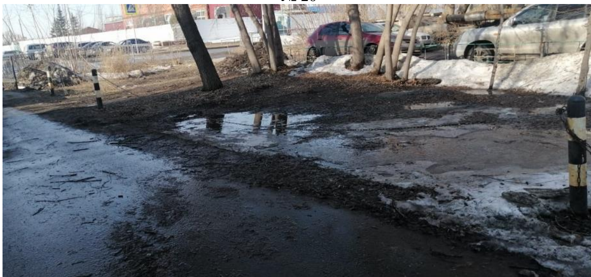
г. Омск, Кировский АО, в 25 м. северо-западнее многоквартирного дома № 11А по ул. Авиагородок