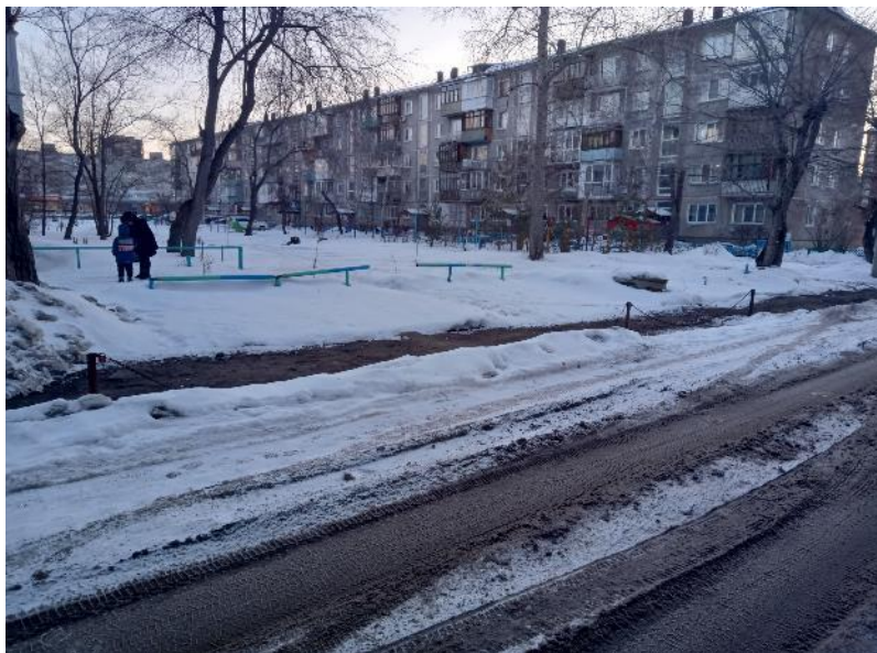
г. Омск, Ленинский АО, в 12-48 м. северо-восточнее многоквартирного дома № 11 по ул. Рождественского