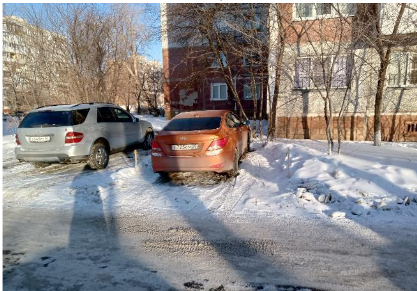
г. Омск, Кировский АО, в 6 м. юго-западнее многоквартирного дома № 1 по ул. Бережного