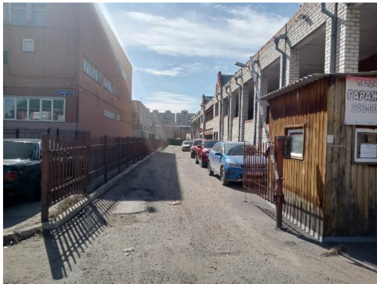
г. Омск, Советский АО, в 3 м. юго-восточнее гаража, расположенного по адресу: ул. Волховстроя, д. 9