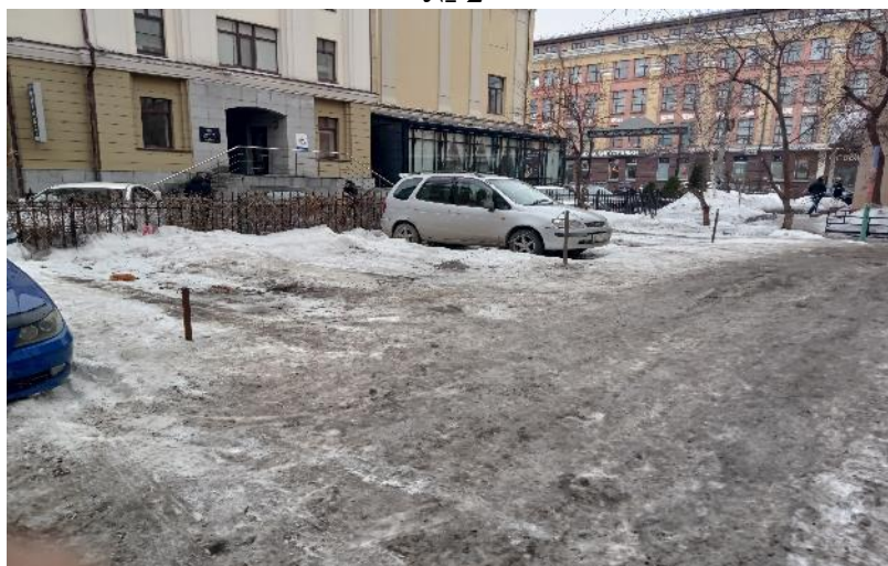
г. Омск, Центральный АО, в 7-18 м. северо-западнее многоквартирного дома № 34 по просп. Карла Маркса