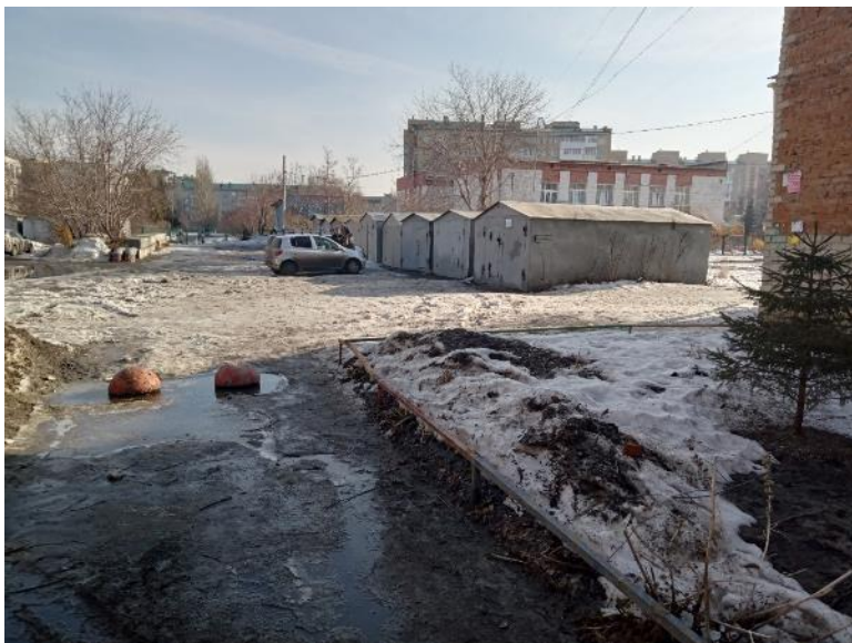
г. Омск, Кировский АО, в 8-10 м. северо-западнее многоквартирного дома № 106 по ул. 12 Декабря