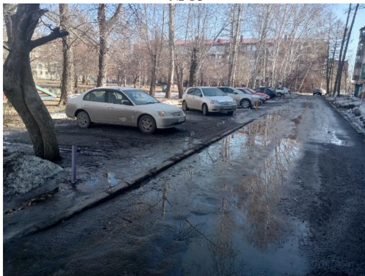
г. Омск, Октябрьский, в 10-12 м. северо-западнее и в 10-17 м. северо-восточнее многоквартирного дома № 14А по ул. 75-й Гвардейской бригады