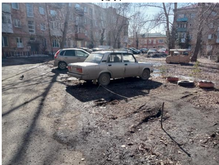
г. Омск, Центральный АО, в 11-17 м. западнее многоквартирного дома № 83 по ул. Челюскинцев