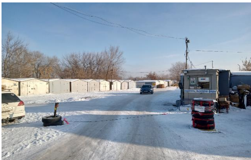
г. Омск, Кировский АО, в 150 м. юго-восточнее здания № 18/5 по ул. Рокоссовского