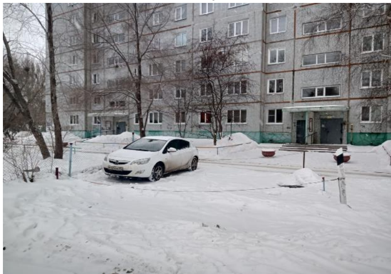
г. Омск, Кировский АО, в 13-18 м. северо-восточнее многоквартирного дома № 3 корпус 2 по бульвару Архитекторов