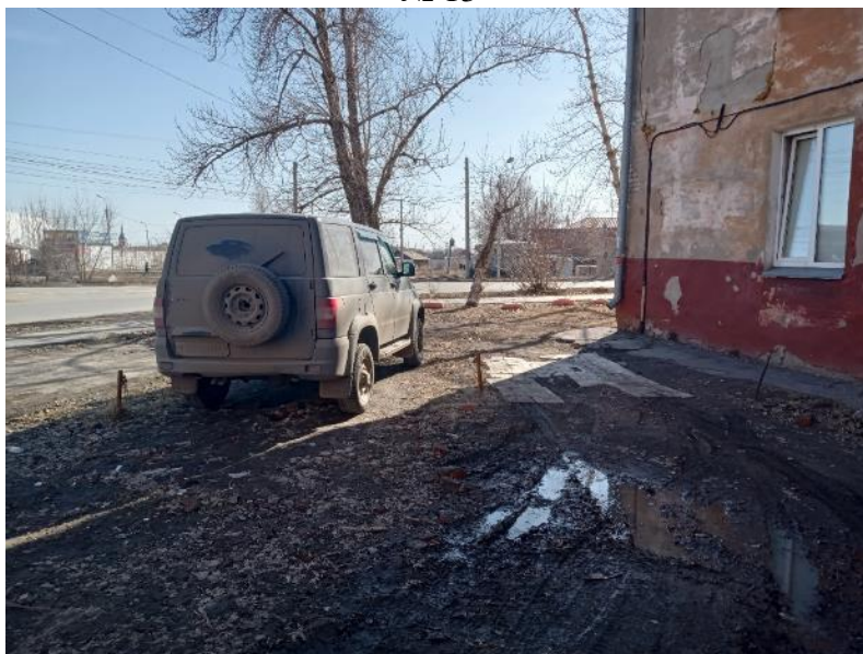
г. Омск, Центральный АО, в 2-8 м. восточнее многоквартирного дома № 209 по ул. 5-я Северная