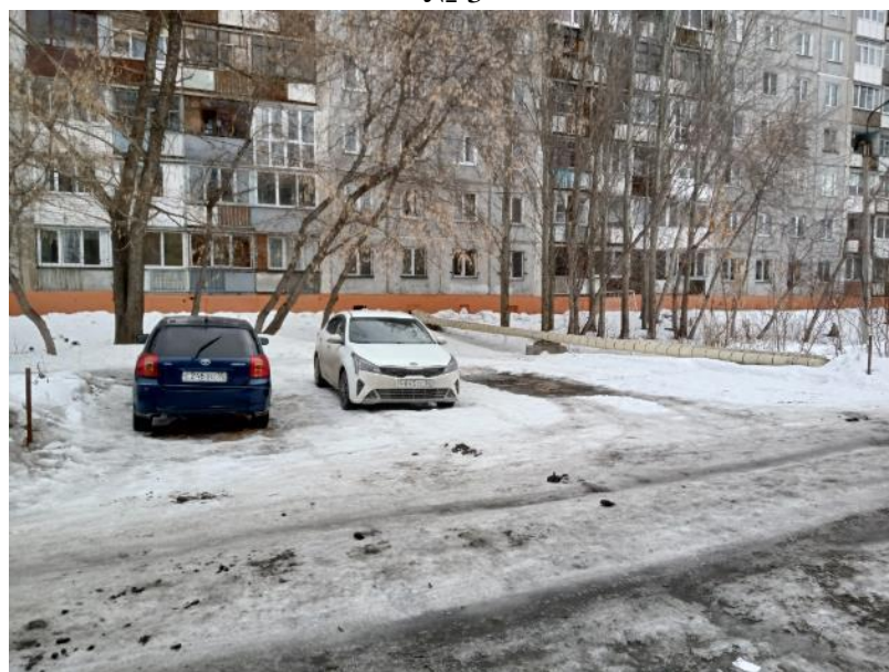
г. Омск, Центральный АО, в 20 м. западнее многоквартирного дома № 128А по ул. Лермонтова