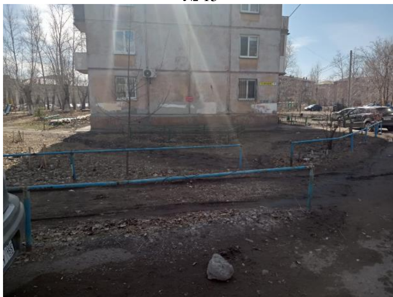
г. Омск, Советский АО, в 14-17 м. северо-восточнее многоквартирного дома № 6 по ул. 22 Апреля