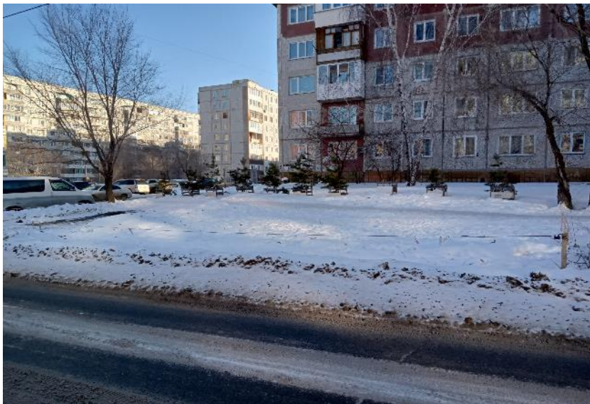
г. Омск, Кировский АО, в 25 м. северо-западнее многоквартирного дома № 5 по ул. Комкова