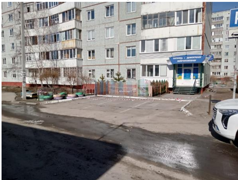
г. Омск, Октябрьский АО, в 12 м. юго-восточнее многоквартирного дома № 18/2 по ул. Кирова