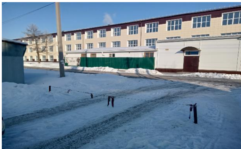
г. Омск, Центральный АО, в 13 м. северо-восточнее индивидуального жилого дома № 111 по ул. 2-я Амурская