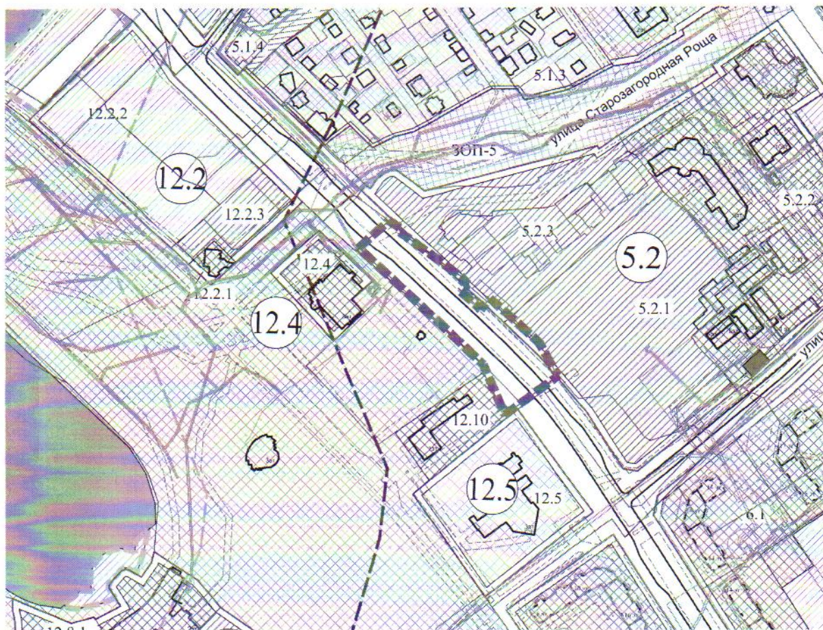
Схема для разработки документации