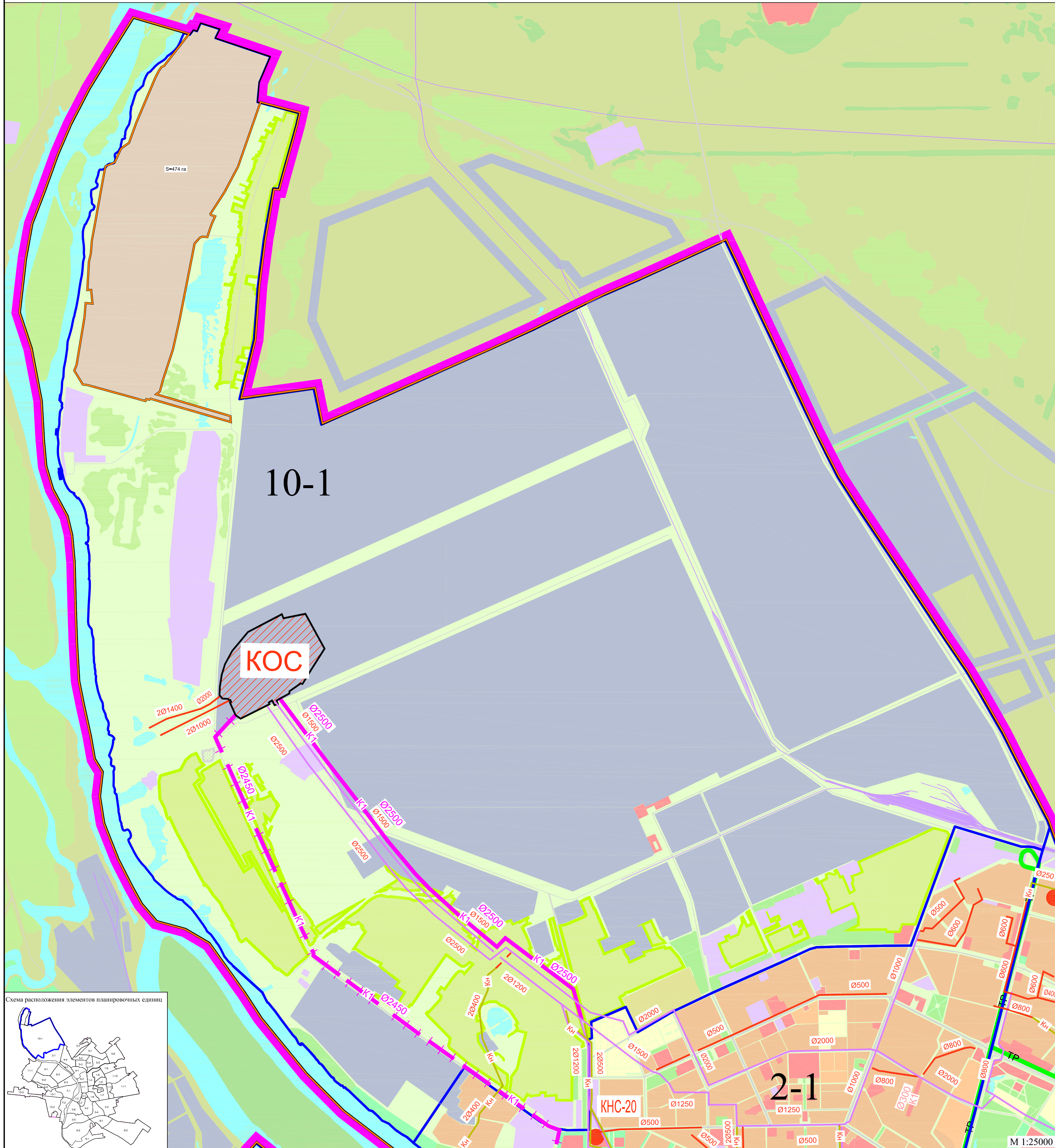
Схема расположения элементов планировочных единиц