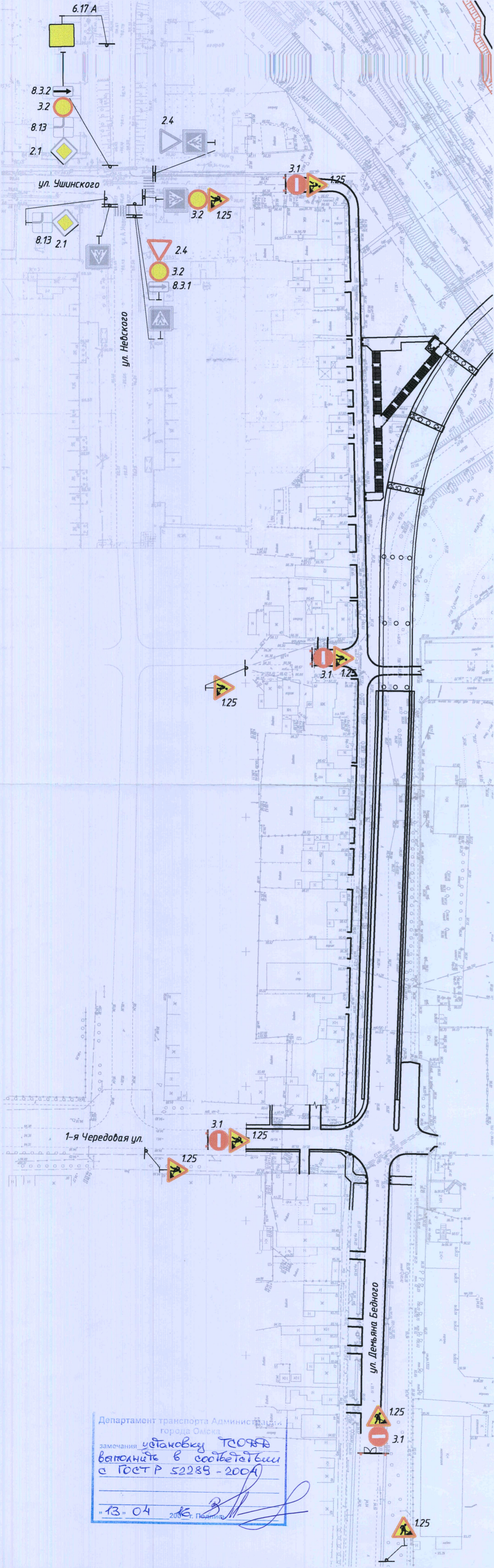
Схема временного ограничения движения на период строительства

СХЕМА ОРГАНИЗАЦИИ ДВИЖЕНИЯ ОРГАНИЗАЦИЯ ДВИЖЕНИЯ И ОГРАЖДЕНИЯ МЕСТА ПРОИЗВОДСТВА ДОРОЖНЫХ РАБОТ при строительстве транспортной развязки на пересечении ул. 15-я Рабочая с ул. Хабаровская со строительство путепровода через ж/д пути Название организации ООО "Сибмост-Стропроект" транспортная развязка на пересечении ул. 15-я Рабочая с ул. Хабаровская со строительство путепровода через ж/д пути Название объекта ул. Хабаровская со строительство путепровода через ж/д пути Вид и характер дорожных работ строительство Сроки исполнения работ с 0ч. 00 мин 16.06.2016 по 23ч. 59 мин 31.07.2016 Ответственный за проведение дорожных работ Быков М.Б, тел.: 21-14-18 Схема составлена ООО "Сибмост-Стропроект"